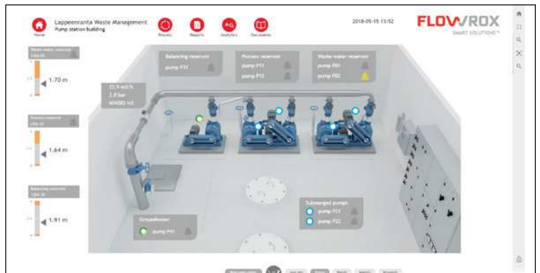
Station de pompage EKJH et vue à distance dans Flowrox Malibu.