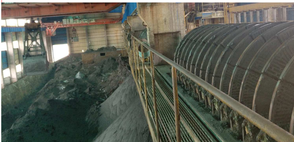
Le filtre à disques en céramique Flowrox est particulièrement efficace pour la filtration des résidus de cuivre.